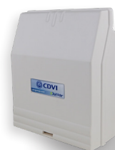
Gescheiden elektronica (meegeleverd)